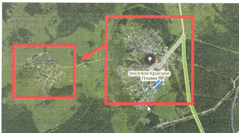
Рис 3. Принадлежность к зоне обслуживания

Например, Деревня Хорошево находится на расстоянии около километра от п. Красное Пламя, т.е. автоматически попадает в 4 зону обслуживания.