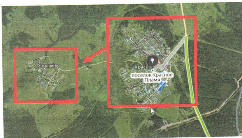
Рис 3. Принадлежность к зоне обслуживания

Например, Деревня Хорошево находится на расстоянии около километра от п. Красное Пламя, т.е. автоматически попадает в 4 зону обслуживания.