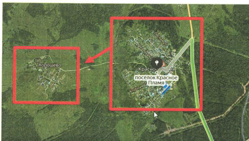
Рис 3. Принадлежность к зоне обслуживания

Например, Деревня Хорошево находится на расстоянии около километра от п. Красное Пламя, т.е. автоматически попадает в 4 зону обслуживания.